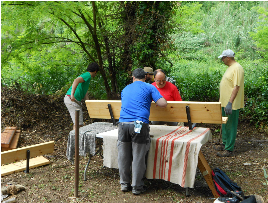
Restauració popular de la font de Sant Muç, el 20 de maig de 2012 (Foto: arxiu CEPNA).

Col·laboració: entitats rubinenques i ciutadans que s'hi vulguin afegir.