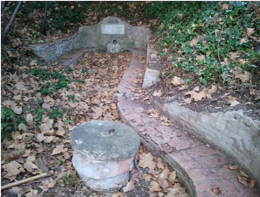
Font de l'Avellana, del conjunt de les fonts de Can Roig. Malgrat la seva rellevància històrica, presenta actualment un estat d'evident deixadesa. Caldria dur a terme una actuació de recuperació.

Si bé l'activitat és gratuïta, hi haurà una guardiola per a fer aportacions voluntàries, que es destinaran a la restauració d'una altra font l'any 2014.