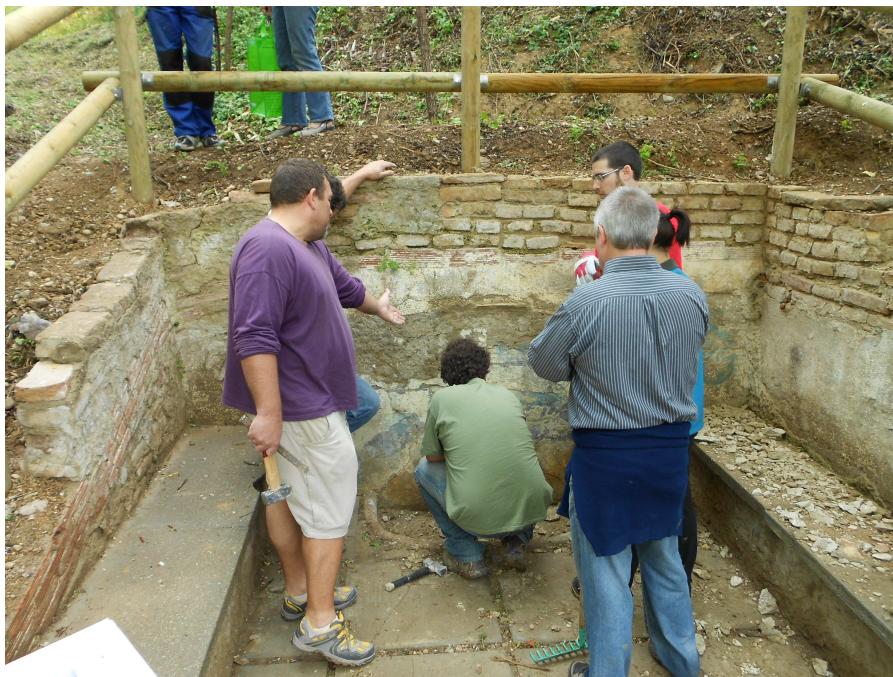
Restauració popular de la font de Sant Muç, el 20 de maig de 2012.

Amb l'entitat convidada, que ha impulsat iniciatives de restauració de fonts, coneixerem l'esforç de la ciutadania per a què, amb o sense recolzament del seu ajuntament, es puguin recuperar aquestes infraestructures hidràuliques i restablir el seu entorn.