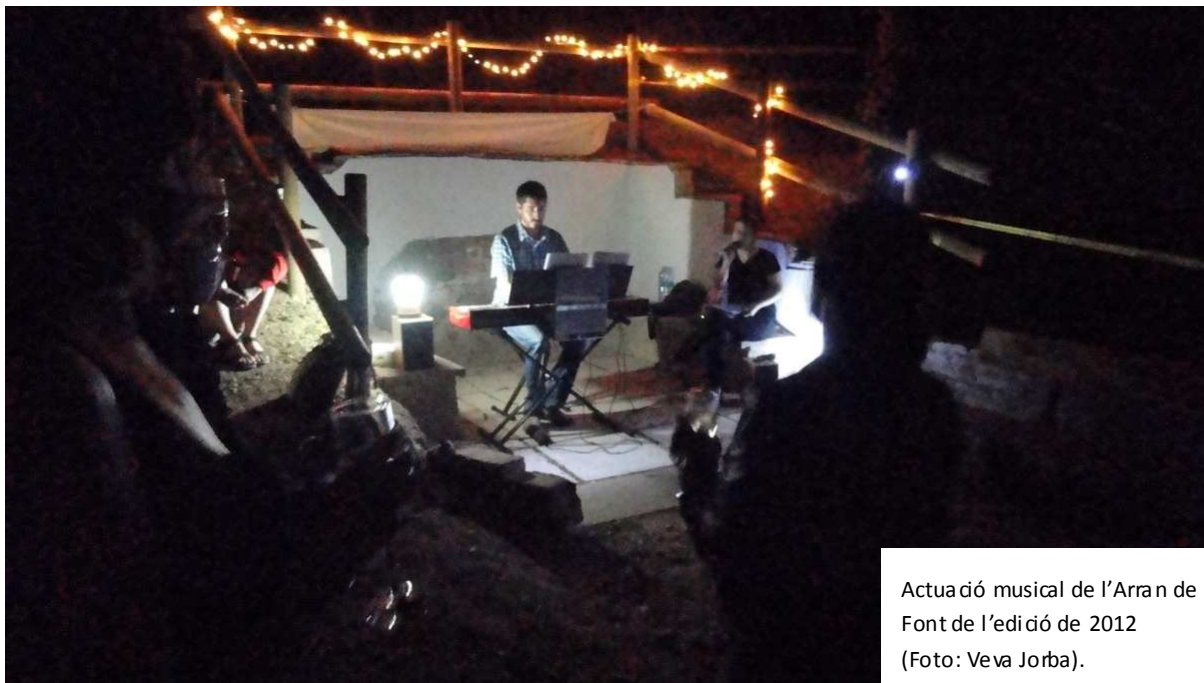
Actuació musical de l'Arran de Font de l'edició de 2012.