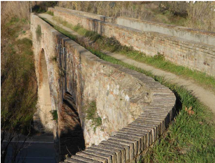
Vista del Pont-aqüeducte de Can Claverí, construït al segle XIX, que servia per a abastir d'aigua el molí del Castell.

Descripció: Ambdues xerrades proposen la revisió dels aspectes més històrics sobre l'aprofitament de l'aigua de la Riera de Rubí: com, des de que entrava al nostre municipi, l'aigua passava per multitud de recs que la duien a horts, fàbriques i molins, i com aquesta aigua era retornada posteriorment a la Riera. Canalitzacions i rescloses avui ja desaparegudes però que foren indispensables per a l'economia rubinenca durant molts anys.